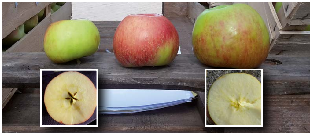
Abb. 5: Im Fall des Apfelanbaus wachsen an Bäumen, die zuvor per Hand bestäubt wurden, extrem viele, kleine Früchte mit unnatürlich vielen Kernen, die nicht zur Vermarktung geeignet sind (links). Wenn die Apfelblüten von Insekten besucht werden, bekommen die Obstbäuerinnen und -bauern den gewünschten Ertrag und die Konsumentinnen und Konsumenten die gewünschte Apfelqualität (Mitte), wohingegen Insektenausschluss zu wenigen und großen Äpfeln, die keine Kerne beinhalten und nur für Most geeignet sind, führt (rechts). Das Beispiel zeigt eine häufige Sorte aus dem biologischen Anbau am Bodensee. 28

Der Rückgang der biologischen Vielfalt führt zum Verlust von Gütern, Leistungen und Werten für den Menschen (Abb. 5 als Beispiel für Bestäubungsleistung). Ökosysteme und damit auch Lebewesen als deren konstitutive Bestandteile stellen Güter und Leistungen bereit, auf die der Mensch essenziell angewiesen ist und deren Wert sich teilweise auch ökonomisch beziffern lässt: 22 Beispielsweise trägt eine erhöhte Kreuzbestäubung von Apfelbäumen durch Wildbienen und andere Insekten zum Fruchtertrag bei und kann die Fruchtqualität in landwirtschaftlichen Kulturen erhöhen. 23 Für die Funktionsfähigkeit eines Agrarökosystems sind zudem viele unauffällige Tierarten und Mikroorganismen wichtig, die Aufgaben bei der Kontrolle von Schädlingen und im Recycling von Nährstoffen sowie als Pflanzen- oder Samenfresser übernehmen. 24 So ist die Häufigkeit von Krankheitserregern und Parasiten bei Pflanzen und Tieren umso niedriger, je diverser ein Ökosystem an Arten ist. 25 Im Acker verringern Samenfresser das Auftreten von unerwünschten Pflanzenarten, die mit den Nutzpflanzen konkurrieren. 26 Blühstreifen und Hecken verhindern die Erosion des Bodens, was unter anderem dem Verlust fruchtbaren Ackerbodens entgegenwirkt. Eine hohe biologische Vielfalt ist für die Stabilität dieser Leistungen notwendig. 27