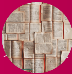
Wissenschaft und Bildung