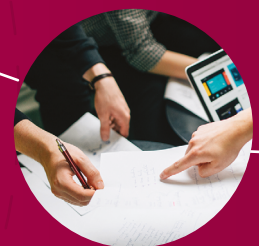
Digitalisierung und Wirtschaft