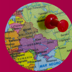
Internationales und Politik