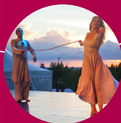
Kultur, Tourismus und Veranstaltungs- wesen