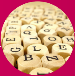
Medien, Journalismus und Buch